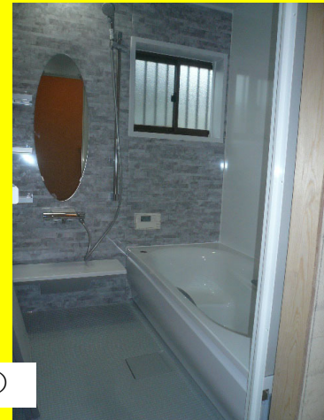
工事前(上) 工事後(右)